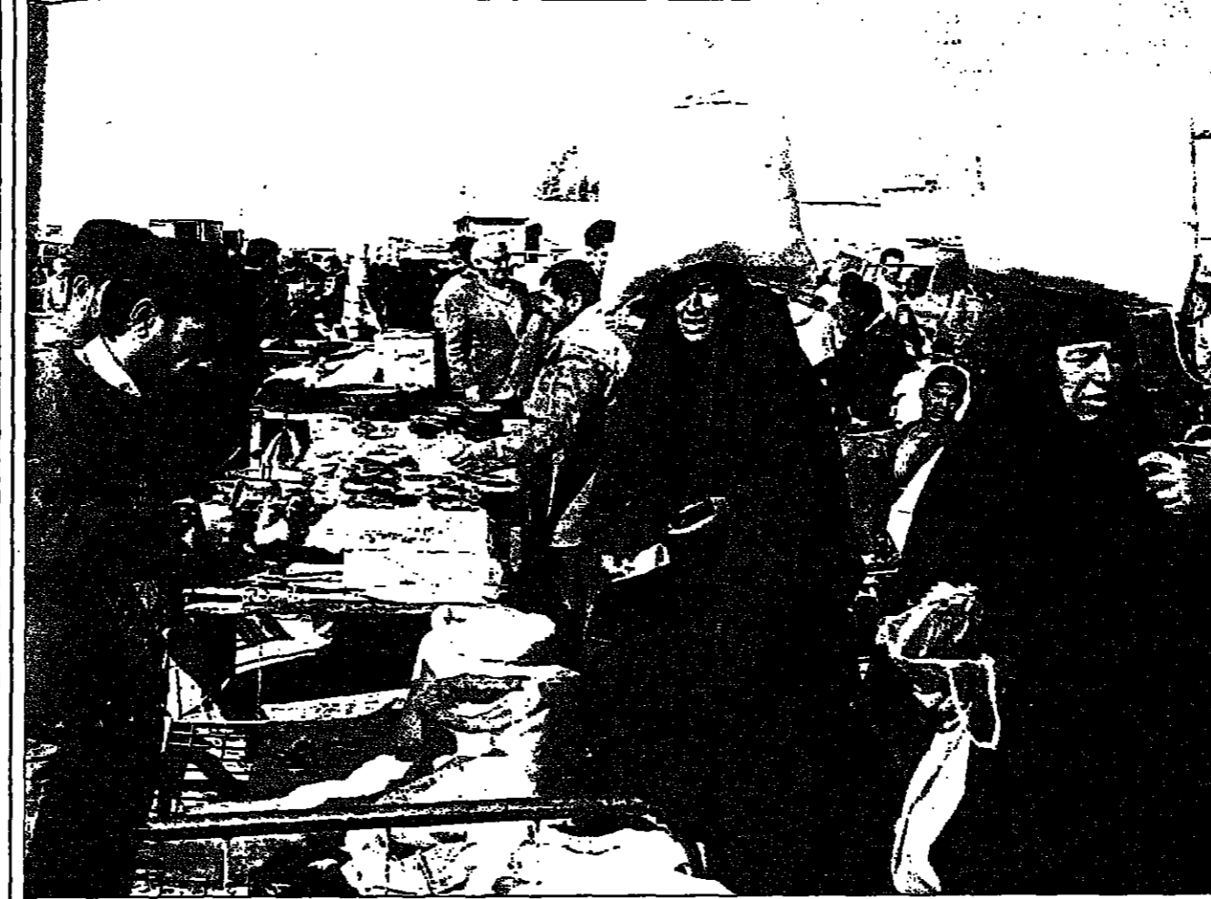
عراقيات في أحد أسواق بغداد

مصادر غربية تحذر من خطوة انتحارية صدام يخشى هجوما لاستعادة اربيل ووفد زائر لعدي يؤكد تحسن حالته سابق الخطط، وتشاركت ان الصالحة للمشاركة التي اجراها الرئيس صدام حسين في الأيام الأخيرة جاءت بسبب سقوط داخلية، وزيادة حدة الاغتيالات والاخترقات الإيرانية لان الداخلي العراقي عبر بعض قوات المعارضة الإسلامية. وكانت الحكومة العراقية التي تحت اشراف ايران رسميا بايواء المجموعة السووية عن محاولة اقتحام عدي وطلابت بتسليمها، كما نجحت قوات تابعة للجيش الثوري الإيراني باقتحام عناصر تابعة لقوات مجاهدي خلق الإيرانية داخل بغداد. من جهة أخرى ذكرت صحيفة «جابل» العراقية امس ان عدي الجبل الابيض العراقي صدام حسين استقبل امس رئيس نادي الشحاتون الرياضي القطري الشيخ خليفة بن حمد آل ثاني في مستشفى ابن سينا حيث يتلقى من الجروح التي أصيب بها في اعتداء بالرصاص. حذرت مصادر غربية من ان الضغوط التي تكثرت على العراق هذه الأيام من الولايات المتحدة وبعض الدول الخليجية قد تؤدي الى خطوة عراقية انتحارية في المعاد. ويوجب هذه القواعد الجديدة سيضع الرؤوف في الطرقات الرئيسية وفي الساحة العامة وفي محيد المؤسسات والادارات العامة. وقال وزير شؤون العاصمة شريف الرحمان في تصريح نشرته صحيفة «الجزيرة» ان مشهور الوضع الأمني هو السيد الرئيسي لهذه الاجراءات التي سيتم تنفيذها في مرحلة لاحقة.